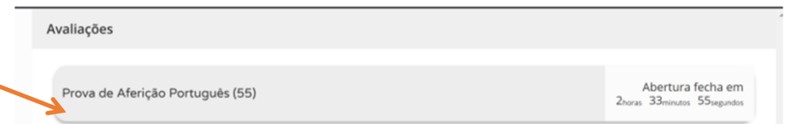
Figura 3 – Acesso à prova a realizar

Para se aceder à prova tem de se clicar em cima da zona cinzenta , onde se encontra escrito o nome da prova