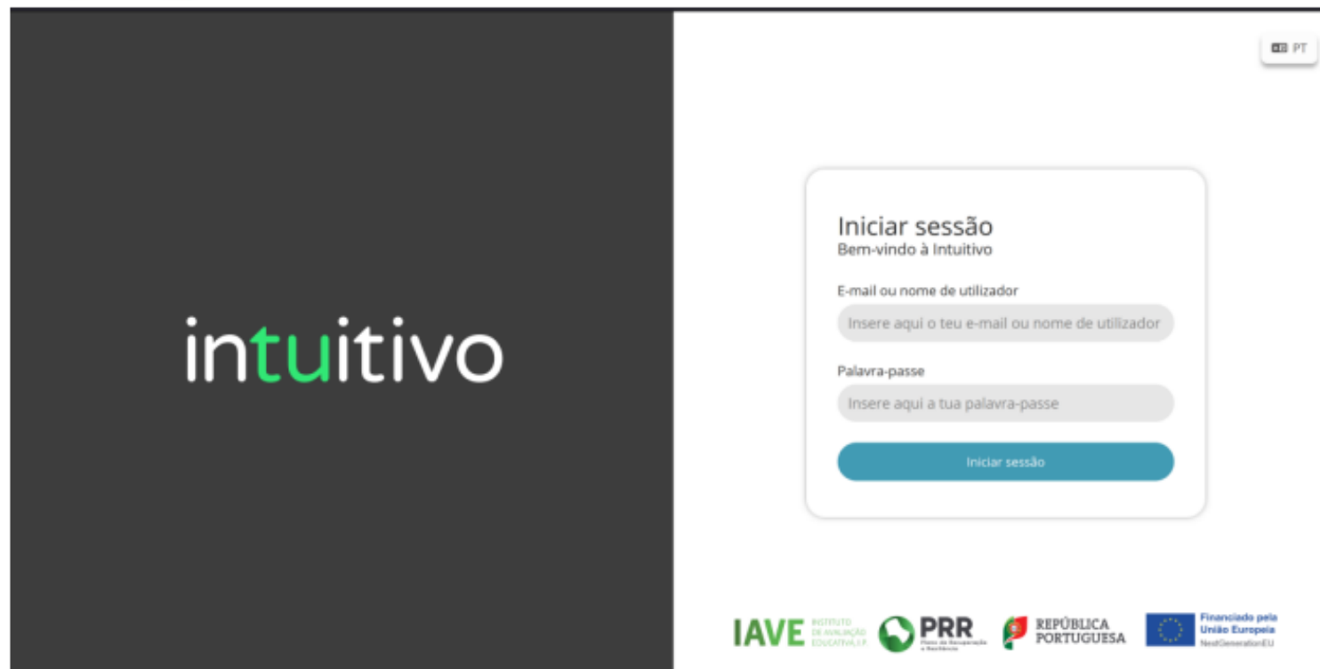
Figura 2 – Acesso à Plataforma das restantes provas